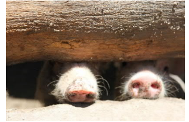
Venter på en dyktig bonde

Skolene i Malawi er ikke gode på kvalitet og ikke gode på yrkesutdannelse. Vi håper derfor at det blir noe av planene om å lage en videregående skole oppe på Songa som kan lære elevene praktiske yrker innen jordbruk og husdyrhold. I så fall ønsker vi å støtte denne både økonomisk og med elever .