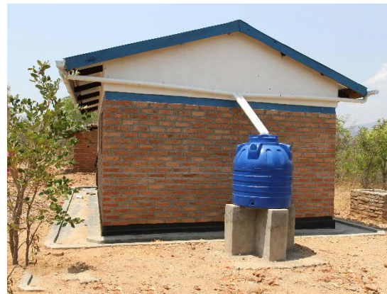
Vårt varemerke: takrenner og vanntank