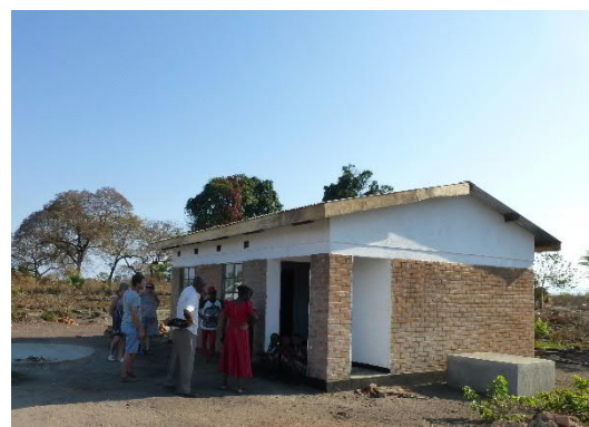
Nytt hus i år - nesten ferdig Mangler takrenner og vanntank