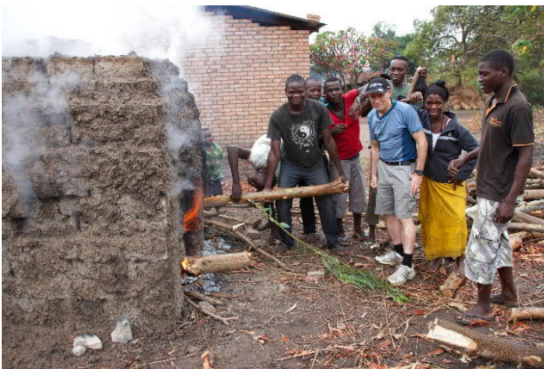
Lokal lavkost mursteinbrenning

Det krevende å finne gode materialer. Lokalt produserte dører og vinduer er av svært varierende kvalitet, de importerte er dyre. Transport på de lokale veiene er også en stor utfordring. Vi begynner å få et visst grep om dette, men har stadig mye å lære. Til neste år vil vi bygge minst to nye hus. Vi kommer til å legge vekt på at familiene bidrar selv, enten i form av mursteiner eller ved å stille opp med arbeidskraft.