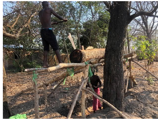
Lokalt lavkost sagbruk